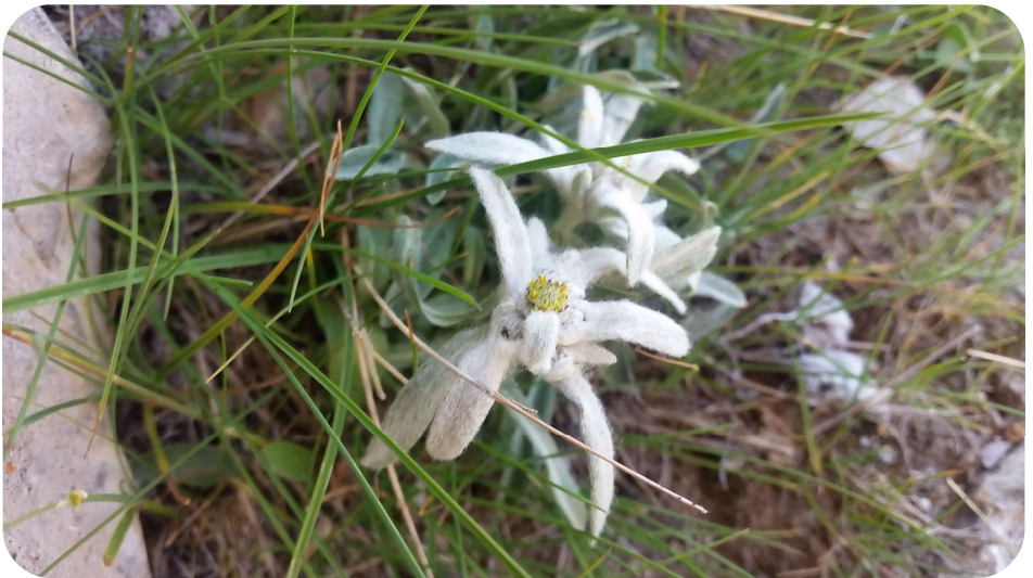
Photo : édelweiss Dolomites de Brenta